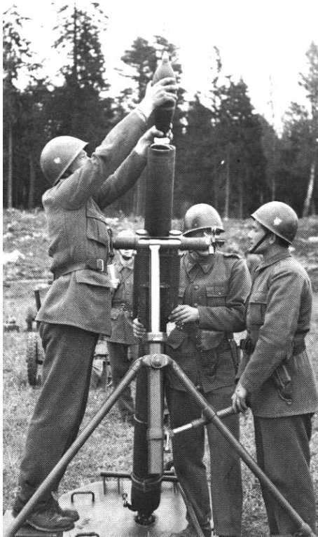
12 cm granatkastare m/41, med svensk mandskab.

Det var nok ikke lige denne velkomst morterfolkene og de øvrige brigaderer havde ventet, da de gik i land i Danmark, men som situationen havde udviklet sig, så blev de modtaget af feststemte danskere og ikke af en krigerisk fjende.